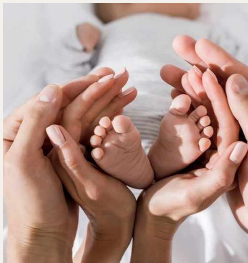
ПРОГРАММА «МАМА И МАЛЫШ»