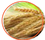
小麦软质, 小麦硬质, 黑麦B组 黑麦A组