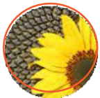
向日葵2级 向日葵1级 向日葵顶级