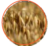
荞麦, 大麦, 燕麦